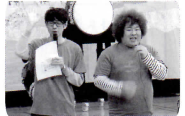
司会 お笑いタレント「ものいい」