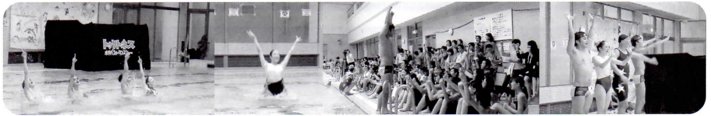
エキシビジョン 毎年恒例のトリートネス